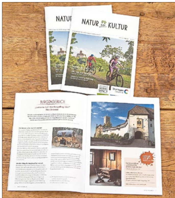
Neues Erlebnismagazin der Welterberegion Wartburg Hainich

erhältlich. Das „Infomobil“ der WER beliefert zum anderen auf acht Touren über 280 Institutionen, wie Ausflugsziele, Touristinformationen und touristische Knotenpunkte in Thüringen und angrenzenden Bundesländern. Das Magazin liegt zudem in der Welterberegion und weiteren Regionen bei touristischen Einrichtungen wie Beherbergungsbetrieben und Gastronomen aus sowie bei öffentlich zugänglichen Einrichtungen wie Ämtern, Ärzten und Tankstellen.